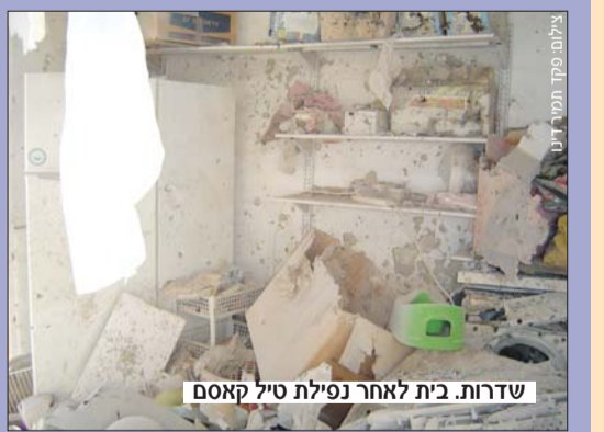
שדרות. בית לאחר נפילת טיל קסאם

יום חמישי בלילה. מבזק חדשות מיוחד. פיגוע במעבר קרני. שישה נפגעים. שלושה מהם תושבי שדרות. מוצאי שבת. שמונה בערב. במהדורות החדשות מתפרסמות תמונות ראשונות מנפילת טילי קסאם בעיר שדרות. התושבים זועמים. בלבי אני אומר, שחייבים לעשות מעשה, חייבים להגיע לשדרות ולהציע את עזרתנו. יום ראשון. בוקר. מפקד מרחב עמקים מברך על הרעיון. "שולחים חמישים שוטרים",